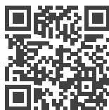
Устав Компании и внутренние документы АО «ФПК»

В АО «ФПК» создано внутреннее подразделение, отвечающее за выполнение функций по осуществлению внутреннего аудита, – отдел внутреннего аудита. Положение об организации внутреннего аудита, положение об отделе и план деятельности отдела утверждаются Советом директоров. Отдел внутреннего аудита подотчетен Совету директоров.